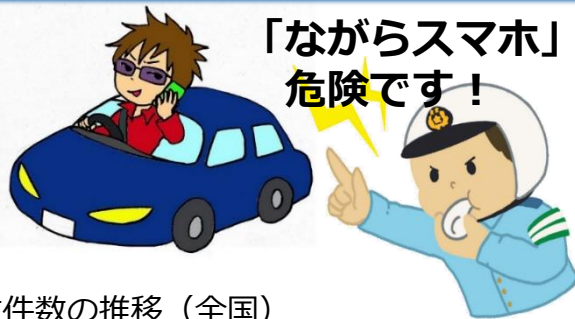
自動車運転時の携帯電話等使用による死亡・重傷事故件数の推移 (全国) (乗用車、貨物車、特殊車)

運転中のスマートフォンの使用や画面注視をきっかけに起きる死亡・重傷事故が増えています。