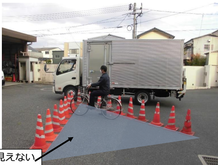
運転手から見えない「 死角 」