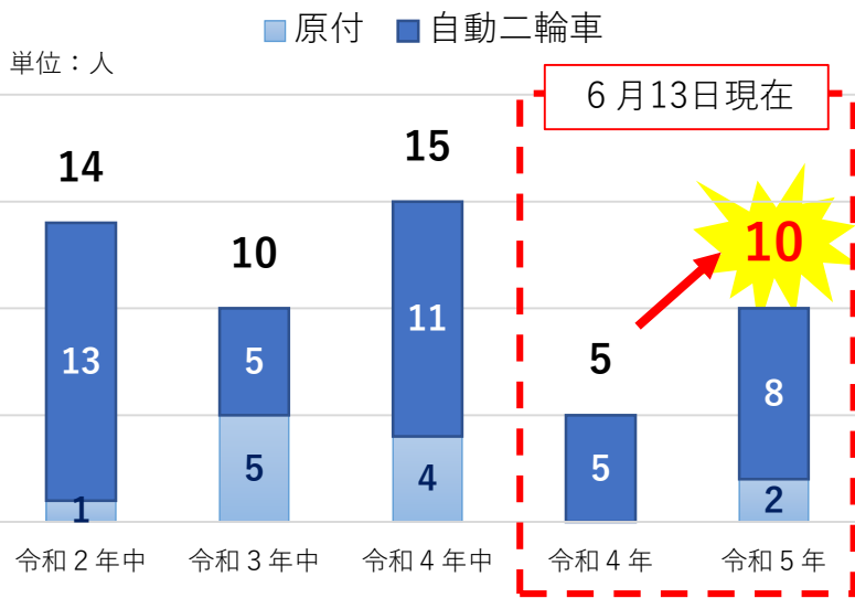
二輪車乗車中の交通事故死者数（広島県内）